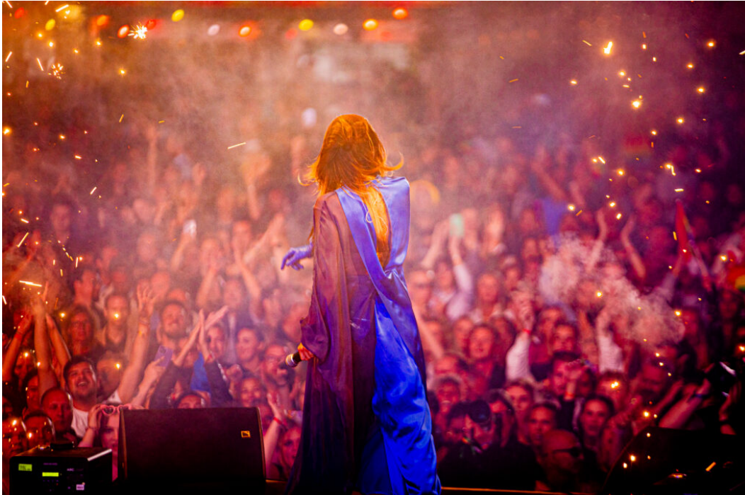
Petra Marklund framför publiken i Pride Park under lördagen.