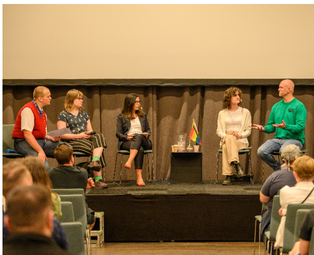
Pride House-Chef HP och Pridehunden Från seminariet: Jämställd idrott för transpersoner