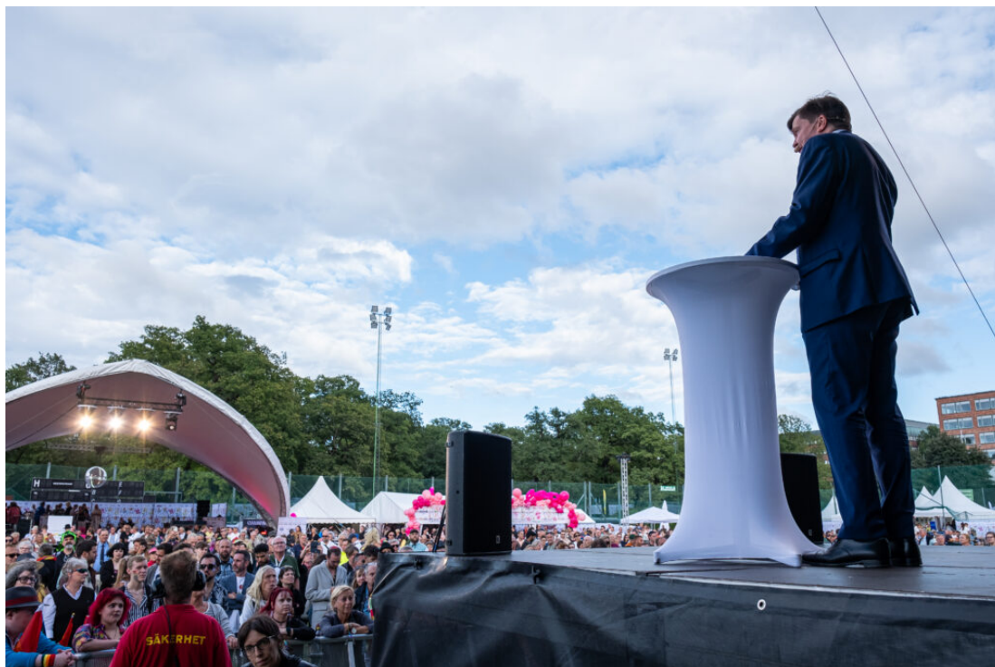
Andreas Norlén under invigningstalet i Park, 2023.