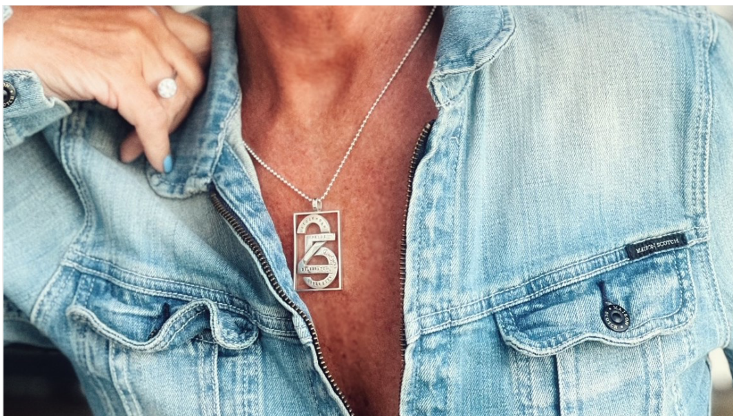
Årets dog tag 2023.

Stockholm Pride firade 25 år genom att välkomna tillbaka Efva Attling som designer av årets DogTag – Stockholm Prides 25:e och sista DogTag. Att få knyta ihop säcken gällande dogtags där Efva som designade den första dogtagen 1998 nu kunde designa den sista och på det uppmärksamma 25-årsfirandet kändes perfekt. Årets smycke var framtaget med extra kärlek och omtanke och ämnade föra in ett tidsperspektiv, därmed var siffran 25 ett givet moment.