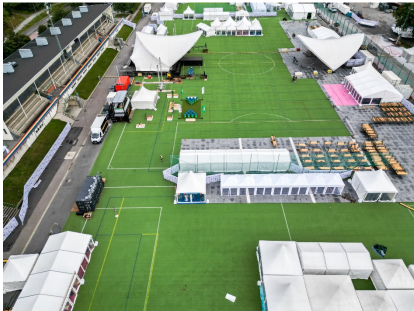
Ett folktomt Östermalms IP.