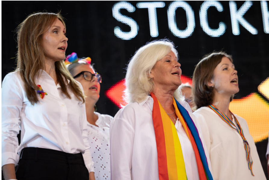
Kvinnokören Sapphonia på scen den andra augusti under invigningen.