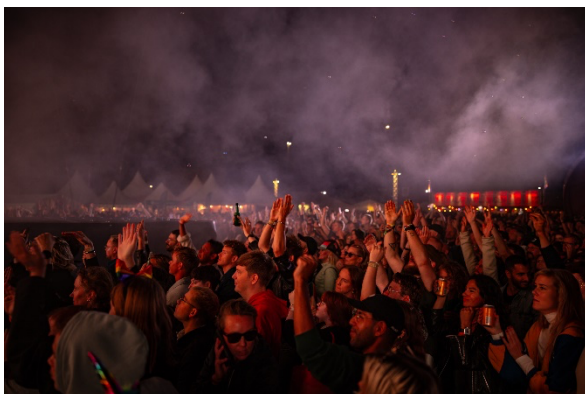
Mingelbild från Park.