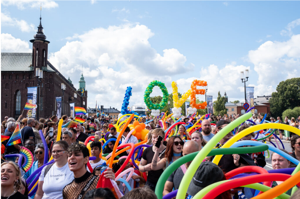
Pride Parade 2023 framför stadshuset.