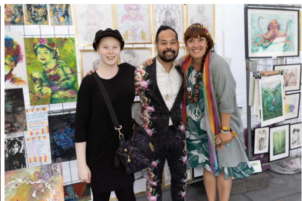
Mingel i Konstnärstättet.